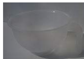
④Σ03主剤、硬化剤混合容器