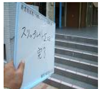
⑩小口の補強、乾燥完了