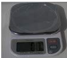
①秤 0.1g単位 3kg用