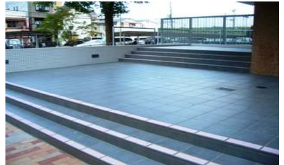
段鼻施工・厚さ 2mm 骨材色 HP-02