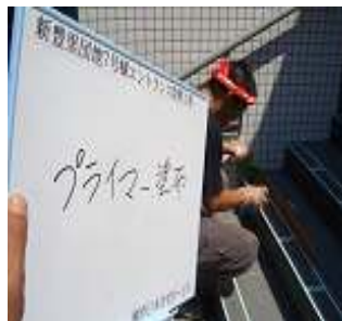
③専用プライマー塗布