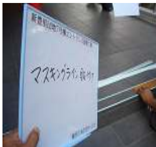
②マスキングライン貼付