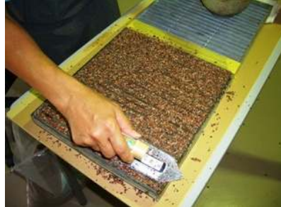
⑥コテを用いて押さえこむ