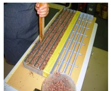
⑥棒等を用いて突く (仕上げ厚に注意)