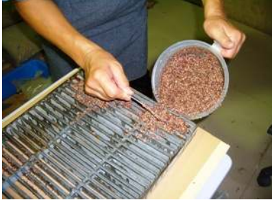
⑤Σ03と骨材を混合したものを; ヘラ等を用いて入れる