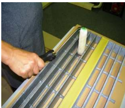
③専用プライマー塗布。