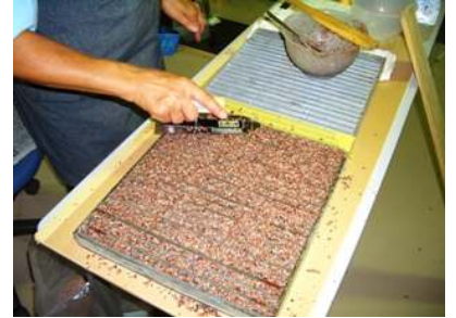
⑦リブの高さで仕上げる