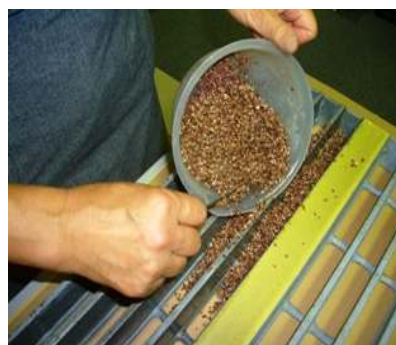
⑤Σ03と骨材を混合したものを ヘラ等を用いて入れる