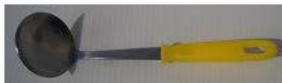
⑦主剤をすくうお玉