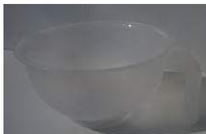
③Σ03主剤、硬化剤混合容器